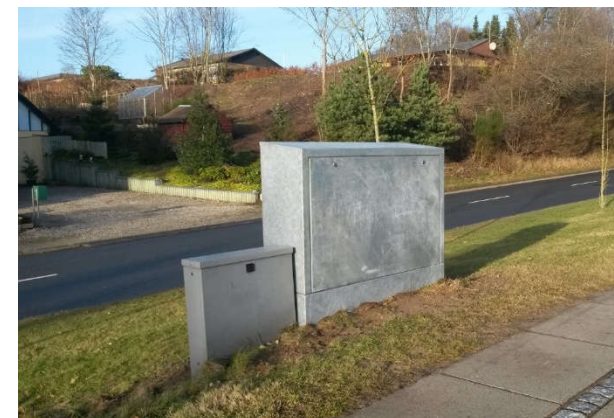
Fjernvarmeskab fremstillet efter kundeønske