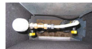
Termostatstyret omløb set indvendig i et fjernvarmeskab