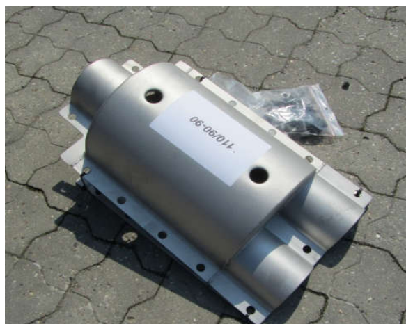
Brianmuffen - fra enkeltrør til twinrør

Flangefittings fra Tjæreborg Industri er fremstillet i rustfrit syrefast stål AISI 316 L svarende til EN 1.4404 i 3 mm godstykkelse.