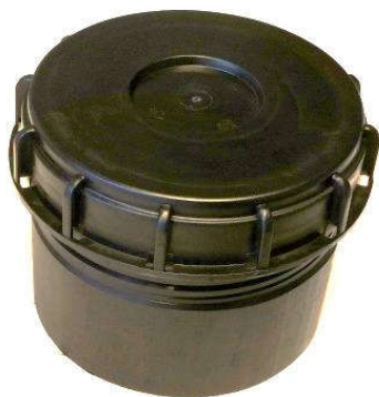
Vandtæt skruelåg og karm, type 1

Det vandtætte skruelåg fås i 3 typer og beskytter fjernvarmeventilen mod ovenfra kommende regnvand, fugt, salt og snavs, herunder bremsestøv, hvilket betyder nemmere betjening og længere levetid.