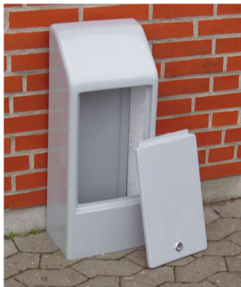
Einführungsschrank Typ 2.