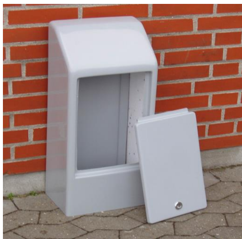
Indføringsskab type 2.